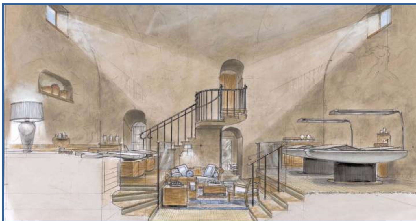
Sala de Tratamento privado "Spa dentro do Spa"

Então relaxe na Suíte Termal, uma série de espaços e níveis conectados que preservam o caráter original do edifício, encorajando uma escolha de banhossequenciais na Sauna de Pedra, Sala Herbal de Banho de Vapor, Piscina de Hidroterapia, Chuveiro Experiência, Fonte de Gelo e o Tepidarium, um espaço fechado incrível de altura dupla com bancos aquecidos de mosaico e banhos escalda-pés para relaxamento entre as seções de banho termal.